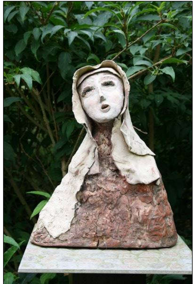
Franciscus in keramiek