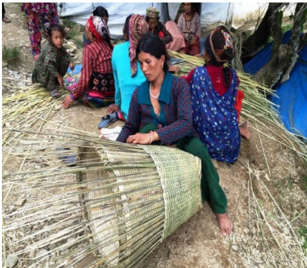
Vrouw weeft bamboe mand voor de verkoop

Help Cordaid en doe 5 en 6 oktober mee aan Sam's kledingactie (lees onze agenda).