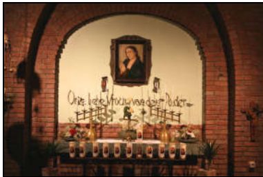
Petrus en Pauluskerk