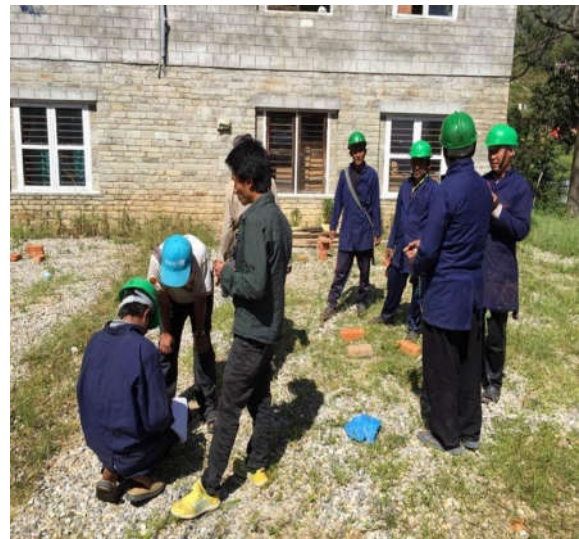
Ontheemde jongeren in bouwtraining