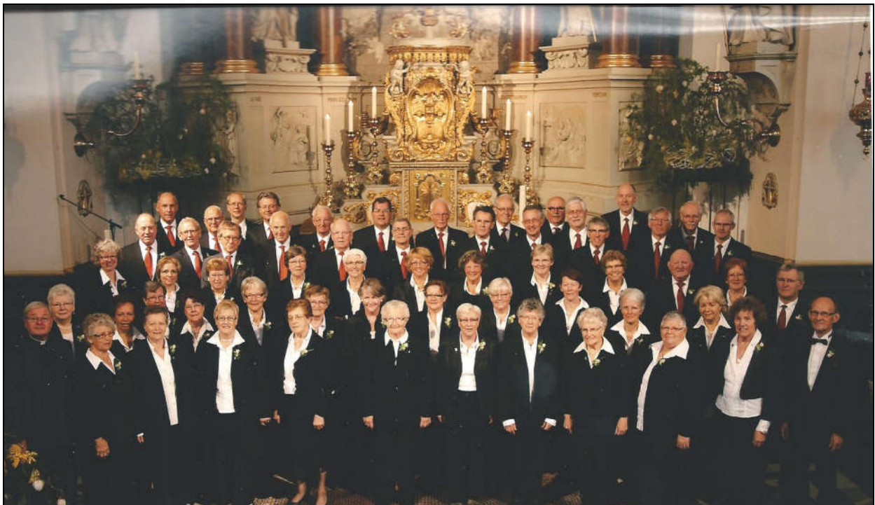
Gemengd Koor Udenhout.

Tijdens de communie wordt het wonderschone Panis Angelicus gezongen.