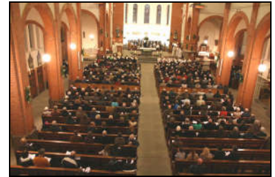
Onze Lieve Vrouwekerk