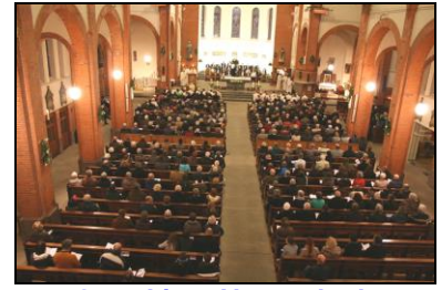
Onze Lieve Vrouwekerk