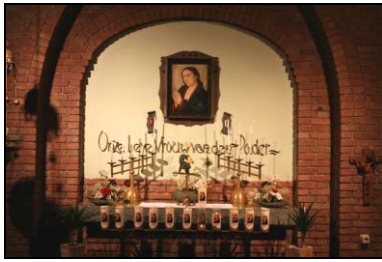
Petrus en Pauluskerk