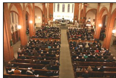
Onze Lieve Vrouwekerk