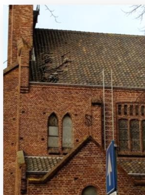
H.H. Petrus en Pauluskerk Middelburg