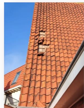
St. Willibrordkapel Domburg