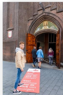
logo's en foto 'kerkbalans.nl'

Alle parochianen hebben een brief van de plaatsvervangend voorzitter en penningmeester van het bestuur gekregen. Daarin wordt een dringende oproep gedaan om een financiële bijdrage te geven aan actie Kerkbalans. We verzoeken u nogmaals, als u nog geen financiële bijdrage heeft gegeven, dit alsnog te doen. Als richtlijn voor de jaarbijdrage geldt daarbij 1% van uw inkomen. Bij een minimum inkomen gaat het in 2022 om een bedrag van € 142,-.