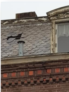
O.L.V. kerk Vlissingen