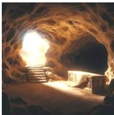
Het verlaten graf

Parochieblad van de H. Maria Parochie Walcheren