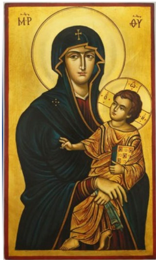
Salus Populi Romani

Parochieblad van de H. Maria Parochie Walcheren