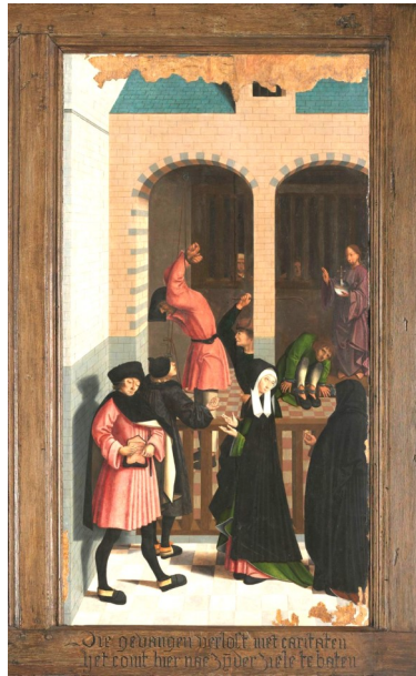
Uitsnede de zeven werken van barmhartigheidschilderij van Meester van Alkmaar 1504