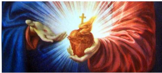
Detail van het schilderij van het Heilig Hart van Jezus door Pompeo Batoni, Kerk van Il Gesù, Rome.